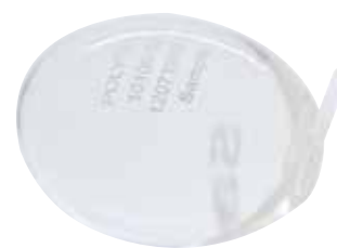
С проводником для иглы

Implants made by POLYTECH – QUALITY made in Germany