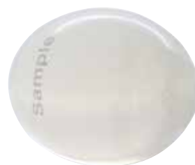
С усиленной крышкой

Заполненные силиконовым гелем или мягким силиконовым эластомером, с усиленной крышкой или с проводником для иглы, доступны в пяти размерах